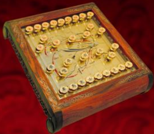
国家权威造币机构采用16道国际领先的造币工艺 精工打造中国象棋——金银版